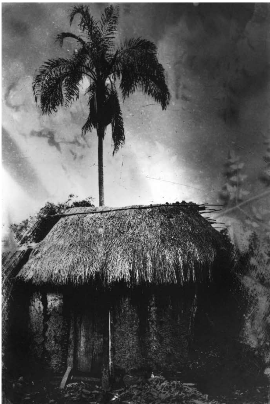
Eustáquio Neves, Crispin V , 2004.

comum entre conhecimento científico, experiência artística e vivência política de todos os dias”. 9