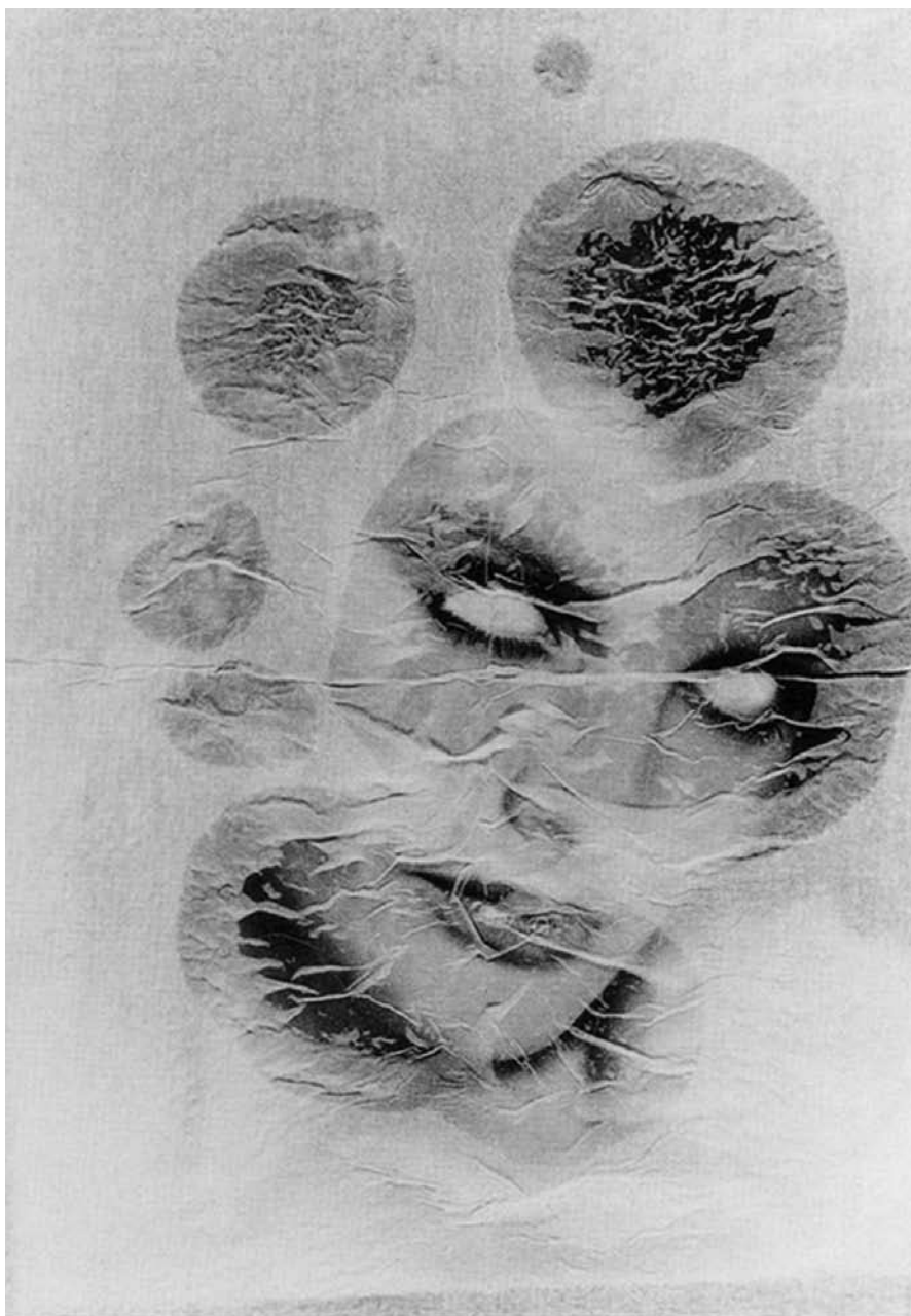
Odiros Mlászho, Antecâmara da Máscara , 2001.

circunscrevê-la em limites bem precisos, como para aqueles que se propuseram a explorá-la em direção da ampliação de sua área de atuação como linguagem e representação.