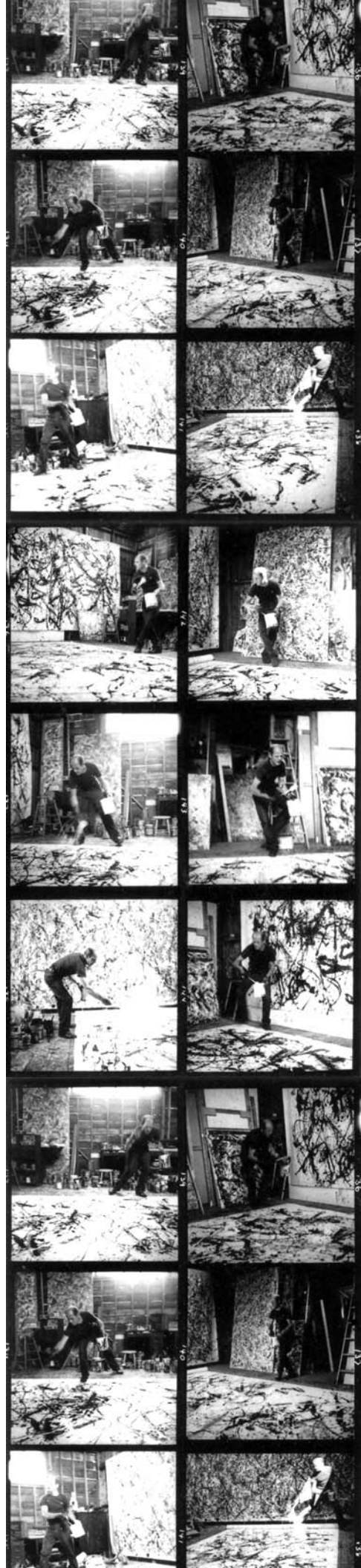
Jackson Pollock pintando em seu estúdio, 1950, fotografado pelo Hans Namuth

Dessa maneira, não se deve pensar que as manifestações artísticas tecnológico-digitais se aproximam do registro da indústria cultural, mas sim, mais exatamente das pesquisas tecnológico-científicas de ponta. 6 Ironicamente, é no âmbito do discurso da indústria cultural, que se vale das tecnologias para produzir toda a ilusão do real, que é disseminada uma visão pessimista sobre a tecnologia. A criatura tecnológica que submete o homem aos