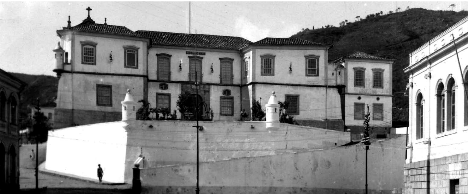
Escola de Minas, Ouro Preto, MG

A criação e o uso das instituições culturais, como um projeto para inserir o Brasil dentre as “nações civilizadas”, revelam a preocupação política com o setor. Por isso, mesmo sem considerar critérios de mérito artístico ou intelectual, a monarquia vislumbrou as possibilidades de criação de uma ambientação que modificasse a imagem do Brasil. A produção artística, principalmente a pictórica, representava a imagem que a monarquia queria passar de si mesma e, por conseguinte, do país. Essa imagem tinha menor repercussão interna que externa, era