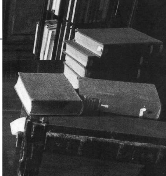
Capa do livro Ficções de Jorge Luis Borges, a Editora Globo S.A.

Muitos escritores afirmam que mergulhar na vida e mergulhar na linguagem é quase a mesma coisa. Pode-se dizer que mergulhar na vida e na literatura é quase a mesma coisa. Alguém contou que se viesse um ditador e lhe pedisse para escolher dentre as disciplinas a qual permaneceria, pois teria